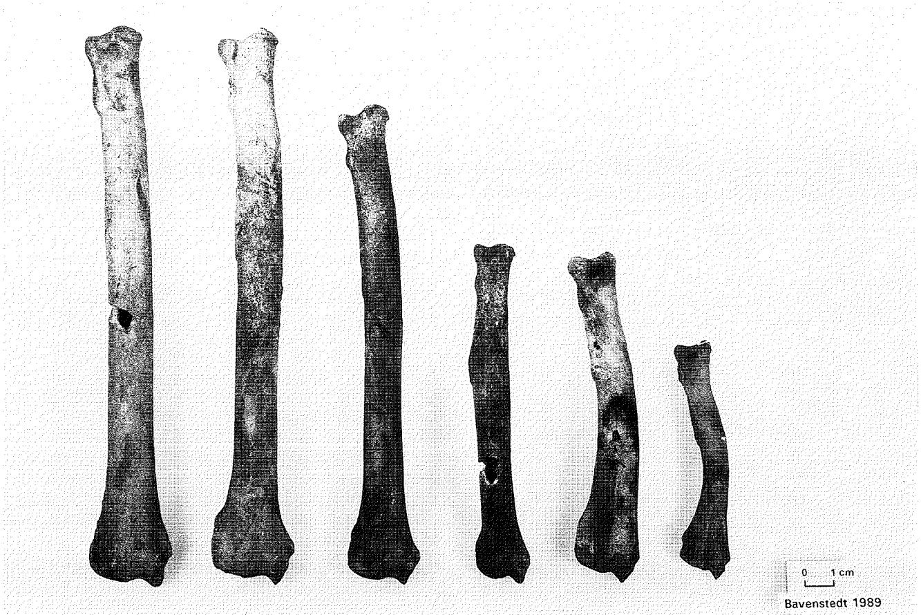
Abb. 1: Haushund. Radius. Variationsbild.

den jüngsten sind unter 1 Jahr, ein gutes Drittel (37,5 %) – bezogen auf die genauer altersbestimmten Tiere – hat ein Alter um 2 Jahre erreicht, die Hälfte (50 %) ist über 5 Jahre geworden, ein Viertel (25 %) sogar um 10 Jahre oder noch darüber. Die in anderen Siedlungen vorliegende Bevorzugung von bestatteten Hunden in »einem guten leistungsfähigen Alter um 2–3 Jahre und nicht älter als 6–8 Jahre« (KRÜGER 1983) ist hier nicht gegeben.